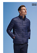
SOL'S WILSON MEN 02898