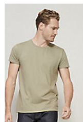
SOL'S PIONEER MEN 03565