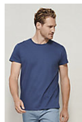
SOL'S CRUSADER MEN 03582