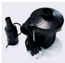
Pompe en option