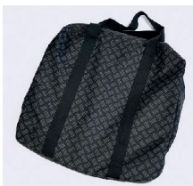
Sac de transport